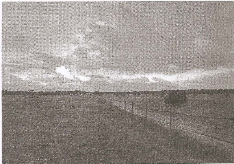
Au cœur de l'île de Ré, le site des Évières a fait l'objet de nombreuses convoitises. Il est désormais la propriété du conservatoire du littoral.