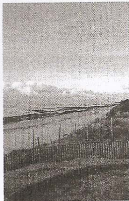
Limiter le nombre d'accès aux plages permet de protéger les dunes.

Ré Nature Environnement emploie le terme de "vigilance" concernant certains projets, comme par exemple le golf, et suggère une politique de gestion et de valorisation des espaces naturels.