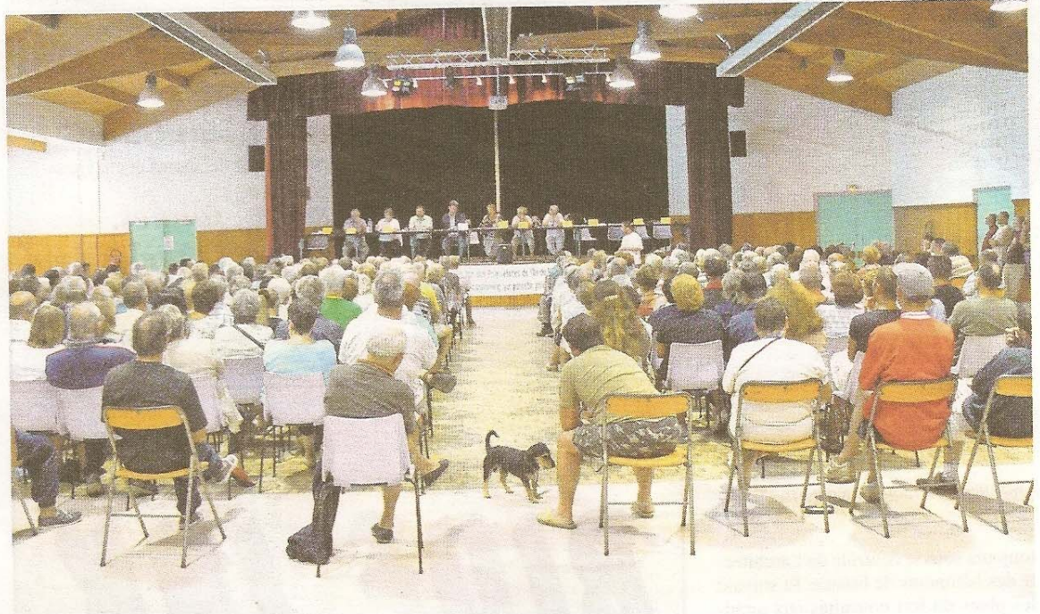
Il y avait foule lors de l'assemblée générale de l'APIR à Rivedoux le 11 août.