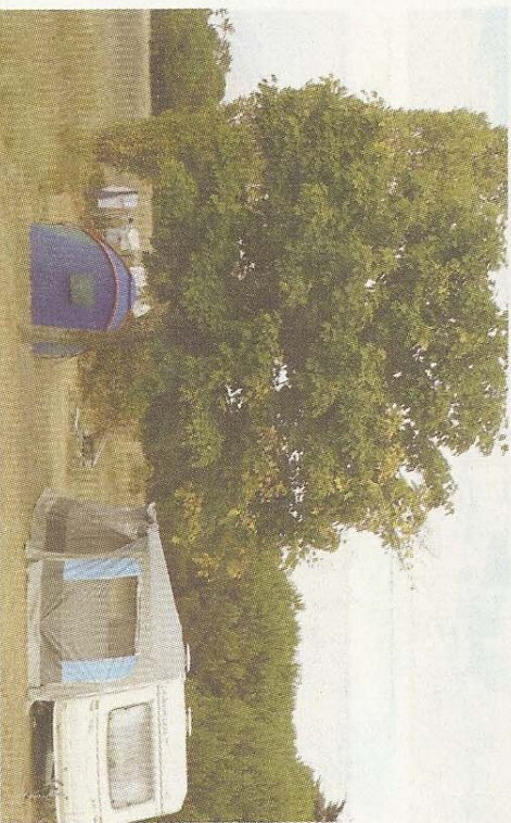
Environ 800 parcelles sont occupées durant l'été.